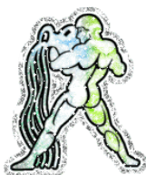
WODNIK 21 stycznia -19 lutego

Wiele Koziorożców będzie prowadzić swoje życie w tym roku, bardzo rozrywkowo. Spotkania towarzyskie, imprezy, wycieczki niezaplanowane - dzięki temu wiele Koziorożców postawi na życie pełne wrażeń, a nie nudnej codzienności.