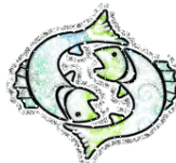
RYBY 20 luty - 20 marca

Jeśli poddadzą się i nie będą walczyć, czeka ich zmiana uczuciowa, przymus szukania sobie kogoś nowego.